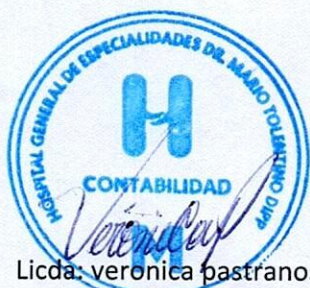
Licda: veronica pastranos peña Encargado de Contabilidad