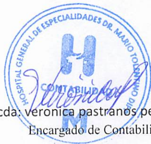
Licda: veronica pastranos peña Encargado de Contabilidad