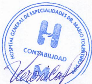
Licda: veronica pastranos peña Encargado de Contabilidad